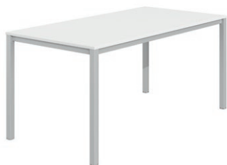
Σταθερό ύψος / Fixed height